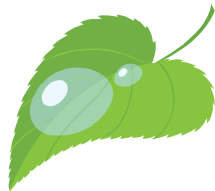
A dew drop