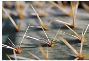
Una planta con espinas