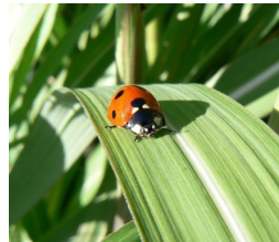
An insect crawling on a leaf