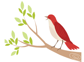
A bird chirping