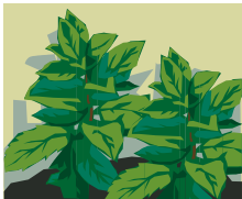
A plant with no flowers