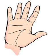
Una hoja que sea más grande que tu mano