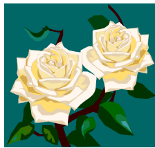
A sweet smelling flower